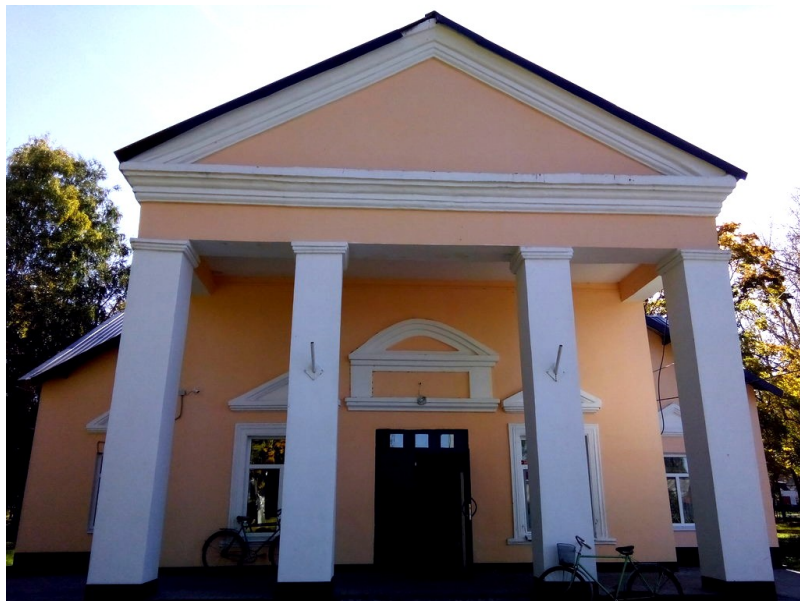
Здание МБУК "Уметский районный Дом культуры"

При районном Доме культуры создан общественный Совет. В него входят: заместитель директора МБУК «Уметский РДК», главный библиотекарь центральной библиотеки, заместитель директора средней общеобразовательной школы, специалист отдела ЗАГСа, преподаватель детской музыкальной школы, директор Дома детского творчества. Работа общественного Совета ведется по плану и в тесном творческом сотрудничестве. Особым