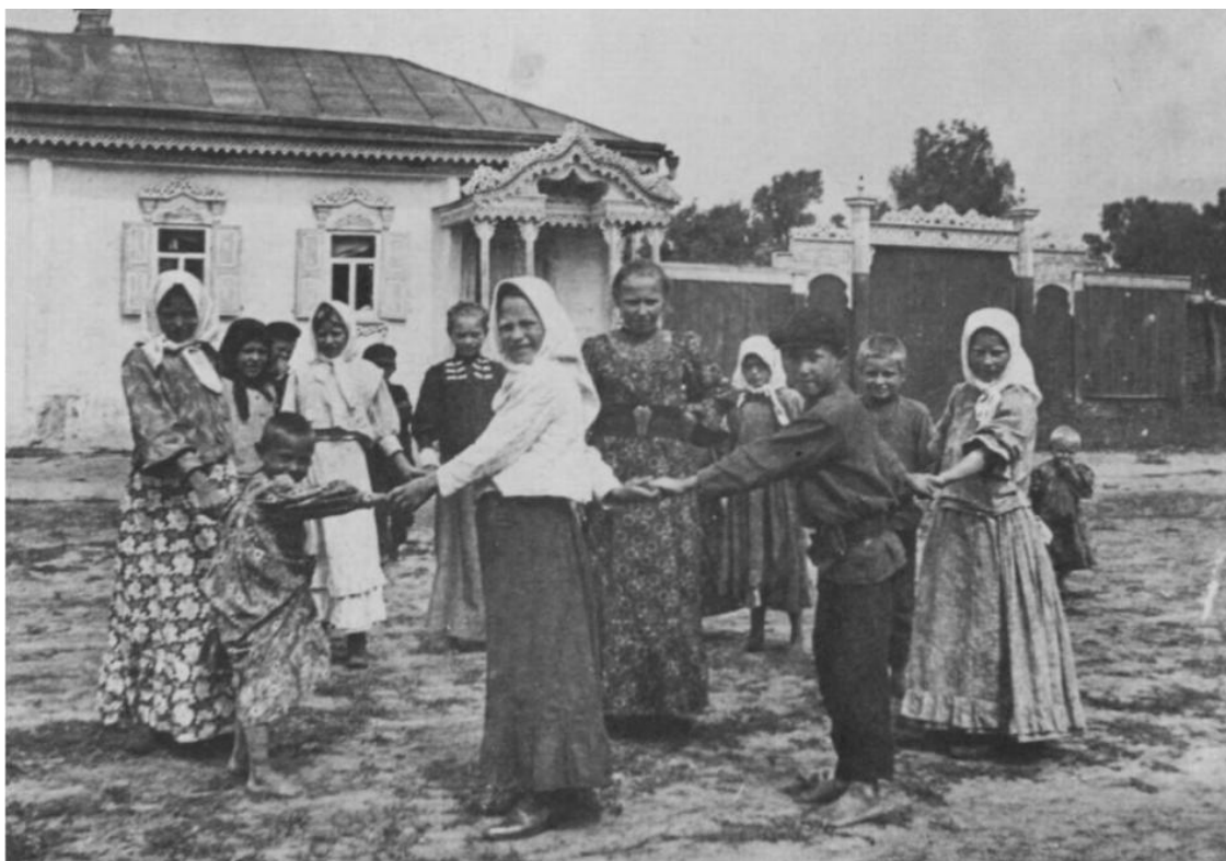
Сцена хороводной игры в тамбовской деревне начала XX века.

Методические рекомендации в помощь участникам Открытого фестиваля исполнителей народной песни «Забывшие песни русской деревеньки»