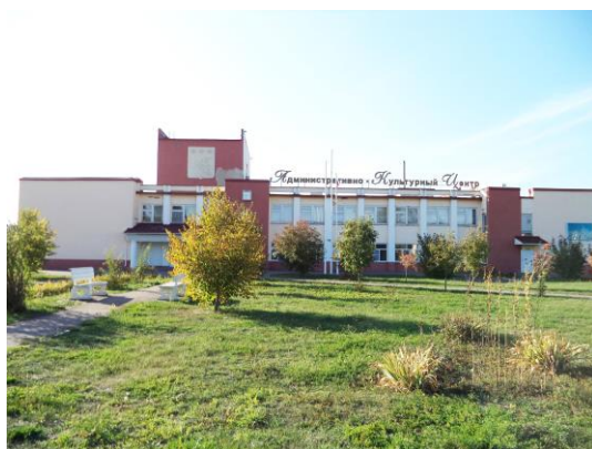
Покрово-Марфинский филиал МБУК «Знаменский РДК»