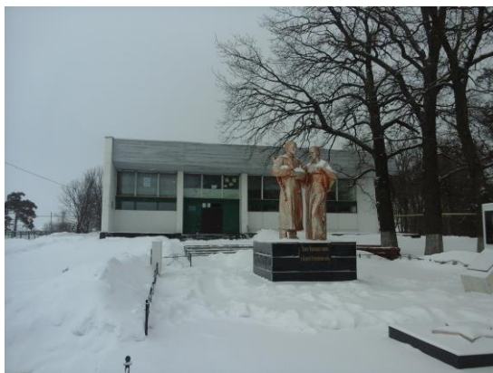
Воронцовский филиал МБУК «Знаменский РДК»