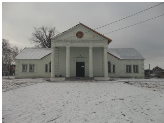
Сухотинский филиал МБУК «Знаменский РДК»